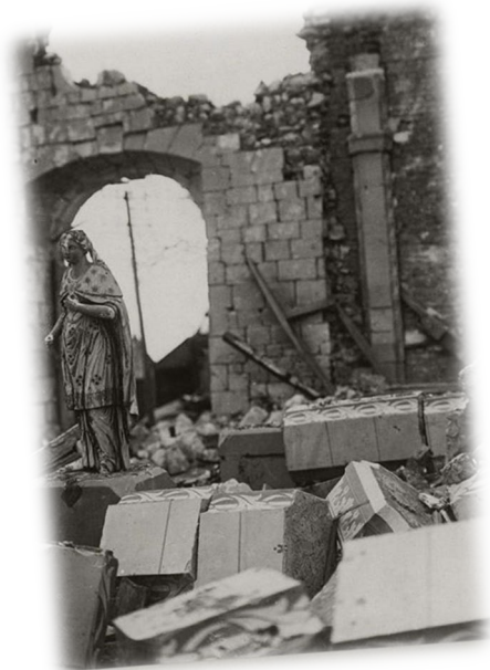
Les ruines de l'église d'Hervilly-Montigny en 1917

Suite à l'exode rural lors de la première guerre mondiale, la population d'Hervilly-Montigny ne retrouvera plus son niveau d'habitant d'origine.